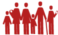
Die neue Familie