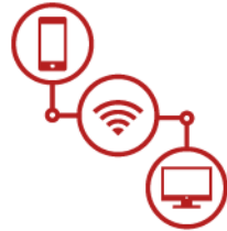
Digital vernetzte Produkte, Angebote & Services