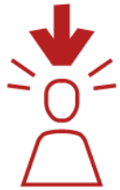
Individualisierung & Personalisierung